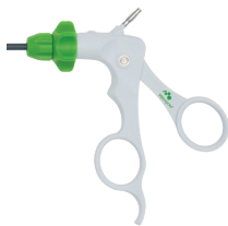
Håndtag type 2 - Maryland