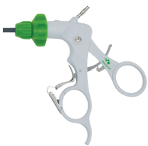
Håndtag type 2 - med crémaillère