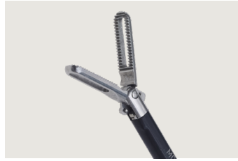
Fattetang - fenestreret