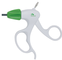
Håndtag type 1 - Maryland