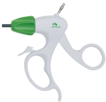
Håndtag type 1 - med crémaillère