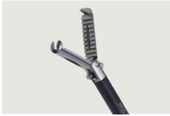
Skarptandet fattetang - Rat tooth